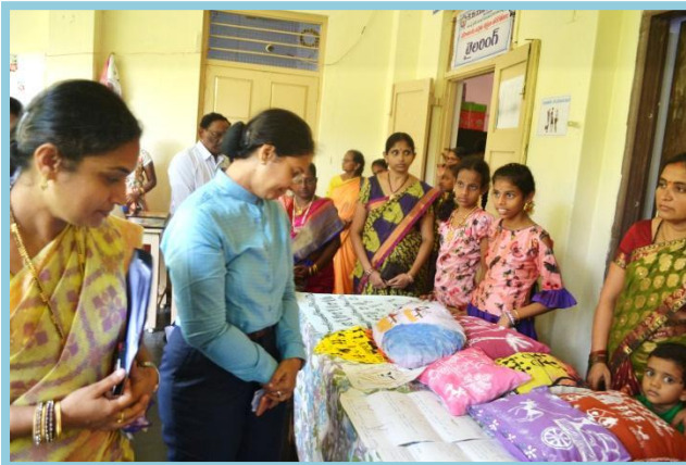
Models of Soft Toys