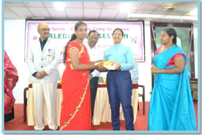
Certificate distribution to Trainers