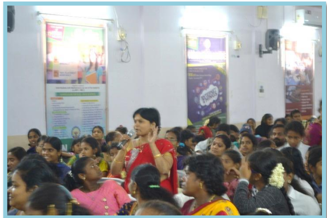
Feedback from Trainees