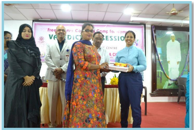
Certificate distribution to Trainers