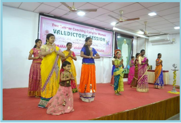
Welcome dance by trainees of Western Dance