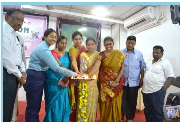
Lighting of the Lamp