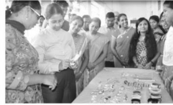
మాట్లాడుతున్న ఎస్పీ కేజీవీ సరిత