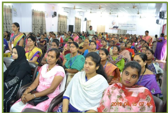
Participants at the Programme