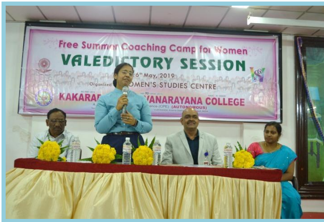
Motivational Talk by Smt. K.G.V. Saritha, Additional SP & Incharge, Women Protection Cell, DGP Office, Guntur