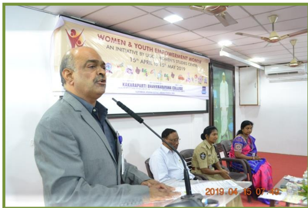
Presidential remarks by Principal