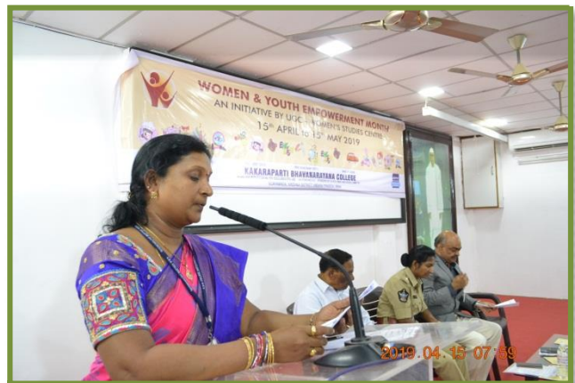
Speech by the Convenor