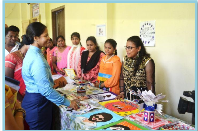
Chief Guest interacting with Trainees