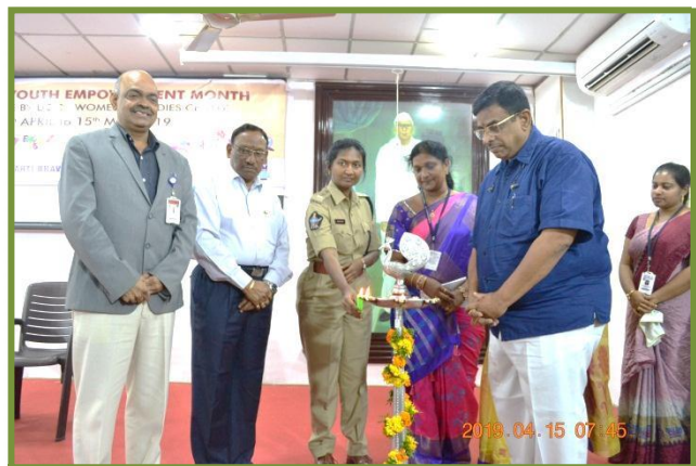
Lighting of the lamp